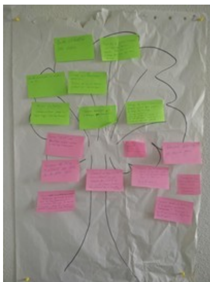
7 post-it vert = solution)

Un arbre à problèmes et solutions a permis aux partenaires de faire des propositions sur les bonnes pratiques ou en réponse aux problèmes rencontrés par les pôles métier.